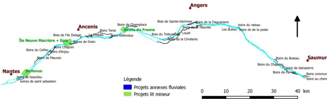
Localisation du territoire et des secteurs concernés

Des actions d'accompagnement portées par le Conservatoire d'espaces naturels de la région Pays de la Loire et le GIP Loire Estuaire sont prévues :