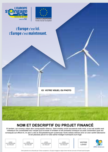
→ Exemple d'affiche (format A3).